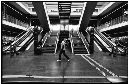
1/5 | Die urbane Seite von Bern.

Auf seinen Bildern zeigt sich die Stadt Bern von ihrer melancholischen Seite: «Berner Impressionen», die Bildserie des 26-jährigen Fotografen und Weltenbummlers Sandro Huber, ist ab Samstag im Lorrainequartier ausgestellt.